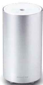
Cool Silver クールシルバー