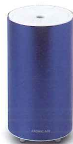
Sapphire Blue サファイアブルー