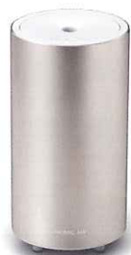
Calm Gold カームゴールド