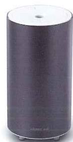
Imperial Gray インペリアルグレー