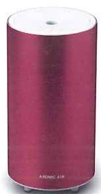
Tender Red テンダーレッド

今なら 本体1台に シトラスカクテル100ml (4,800円) 無料でお付けしています。